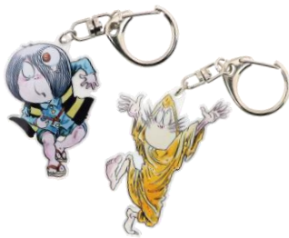
アクリルキーホルダー