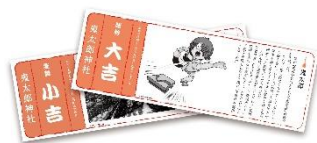
鬼太郎神社おみくじ